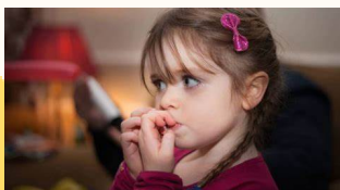
Morderse las uñas (Onicofagia)