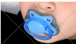
Uso de chupete